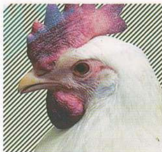
Цианоз гребня и бородачок