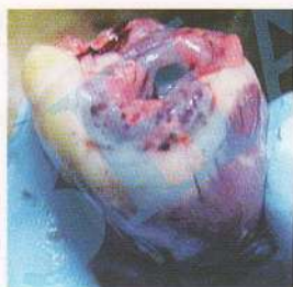
Кровоизлияния и гиперемия сердца водоплавающей птицы