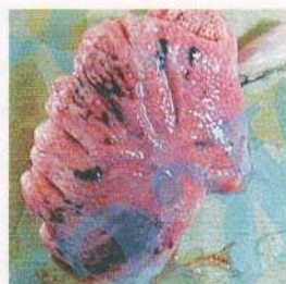
Отек и гиперемия легкого водоплавающей птицы