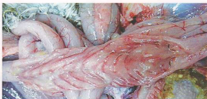
Кровоизлияние слизистой оболочки кишечника водоплавающей птицы