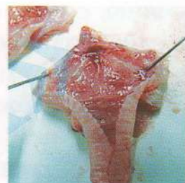
Множественные кровоизлияния в гортани и трахее