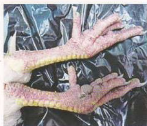
Цианоз лап (посмертный)

ют комплекс прочих противоэпизоотических мероприятий в соответствии с Правилами по борьбе с гриппом птиц, Правилами лабораторной диагностики гриппа А птиц.