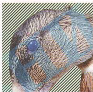
Помутнение роговицы глаз водоплавающей птицы